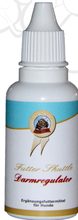
Darmregulator 30 ml | Nahrungsergänzung für Hunde

Über die Darm-Hirn-Achse beeinflusst ein gesunder Darm direkt Verhalten, Stresslevel und Wohlbefinden von Hunden und Katzen.