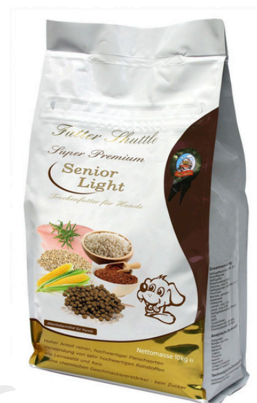
Super Premium Senior Light 10kg - Hundefutter Sensitiv Trockenfutter