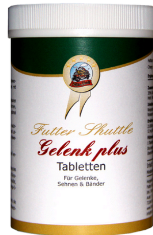
Futter Shuttle - Gelenk Plus 120g – Premium-Nahrungsergänzung für Hunde

Stoffwechselentlastung: Hochverdauliche Proteine reduzieren metabolische Abbauprodukte, entlasten Leber und Niere und helfen, altersbedingten Muskelabbau zu verlangsamen.